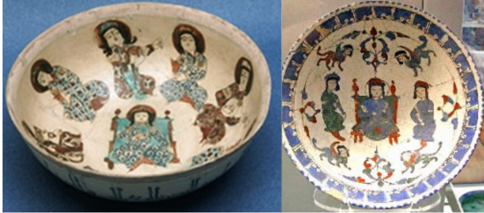
صورة رقم ۲۰: (حسيني، ۱۳۹۱ش: ۷۷)