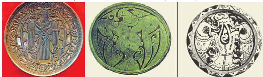
صورة رقم ۱۳: (هندي، قاضي زاده، ۱۳۹۱ش: ۴۹)