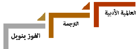
الرسم ٢: العلاقة المباشرة بين الفوز بنوبل والعالمية الأدبية

النتائج المستخرجة من هذا الجدول - على أساس تاريخ نشر ترجمات الرواية - تفسّر العلاقة القائمة بين فوز نجيب محفوظ بجائزة نوبل وترجمة الرواية إلى هذه اللغات. تبيّن النتائج أنّ الرواية قبل فوز محفوظ بجائزة نوبل، ترجمت إلى الإنجليزية - في إنجلترا - فقط. وفي نفس العام أي ١٩٨٨ م، وفور نيل محفوظ بجائزة نوبل ترجمت الرواية إلى الإنجليزية في الولايات المتحدة. ثم انتشرت بالفرنسية، وأيضاً إلى اللغات الأخرى. إذن يمكن أن نتصور علاقة مباشرة بين أهمية نيل جائزة نوبل والعالمية الأدبية.