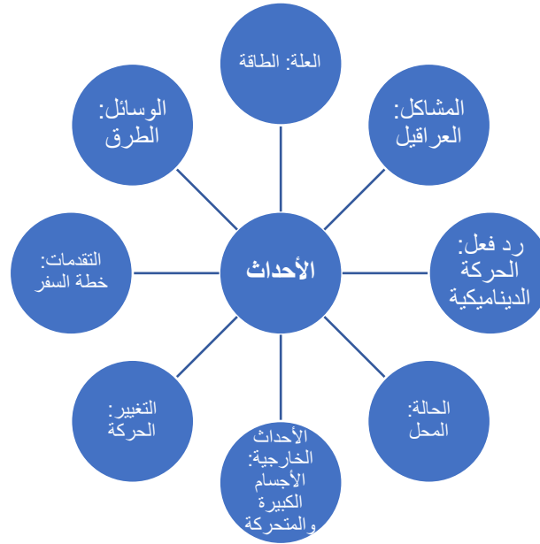
الشكل رقم (٢)