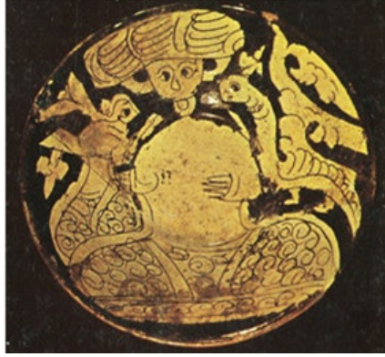
صورة رقم ٤: (كياني وكريمي، ١٣٦٤ش: ٢٧)