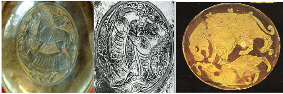
صورة رقم ١٦: (كياي وكريمي، ١٣٦٤ش: ١٥٨) صورة رقم ١٧: (آزادبخت، ١٣٩١ش: ٦٢)

نشاهد في العصر الإسلامي أفولاً في مستوى إنتاج الآثار الفنية المصنوعة من الذهب وذلك يرجع إلى ممنوعية استعمال الأواني الذهبية؛ لأنّ الطبقة الأولى التي كانت تطلب هذه الأنواع من الآثار؛ أي السلاطين الساسانيين وكبار الرجال في الحكومة لم يكونوا يحظون بتلك المكانة السابقة؛ إضافة إلى حظرها الديني في عدم استخدام مثل هذه الأواني والأطباق. لكن تزامن هذا الأفول والضعف في فنّ التذهيب، زاد رونقاً في مجال فنّ الفخار؛ بحيث نشهد له تطوراً ملحوظاً يوماً بعد يوم ويبدو أنّ الفنّانين في العصر الإسلامي رأوا من الفخار بدلاً وتعويضاً مناسباً للأواني والأطباق المعدنية، وقد اعتمدوا في صنعهم هذه على نقوش ومضامين المصنوعات الحديدية الساسانية على الفخار.