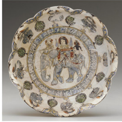
صورة رقم ٥: (بوب، ١٣٨٧ش: ٦٦٢)

الأثار الفنية المتعلقة بالعصر الساساني التي لا تزال معروضة أمام الفنانين في العصر الإسلامي، يمكن اعتبارها الحلقة الأساس في انتقال الموتيفات والمضامين الفنية. نشهد (في الصورة رقم ١٩) زخرفة تتعلق بالعصر الإسلامي على سطح الإناء الفخاري وهي تصوّر لنا زخرفة أهورامزدا وأردشير بابكان بصورة مرئية وظاهرة.