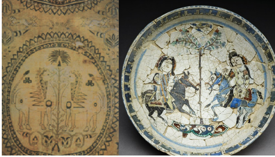
صورة رقم ٨: صورة الجهة اليسرى: قماش ساساني (ناججو، فروزاني، ١٣٩٢: ٢٩)

والصورة الجهة اليمنى لفخّار من العصر الإسلامي