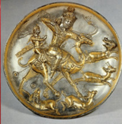
صورة رقم ۹: (ميرزایی، ۱۳۹۲ش: ۹۶)