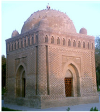
صورة رقم ٢

من الأسباب المؤثرة الأخرى في استمرار النقوش والمضامين الفنيّة؛ هي الحكومات المحليّة ودورها الكبير في حفظ الهوية الوطنيّة الإيرانية في العصر الإسلامي. وعلى سبيل المثال كان الملوك السامانيون ووزرائهم وممثلوهم يتمتّعون بشهرة كبيرة بالنسبة إلى حبيبهم إلى إيران، وكانوا يرغبون جداً في حفظ وتوسيع نطاق اللغة الفارسية، وبذلك كانوا يضمّنون استقلالهم السياسي. ويجب بالطبع أن نذكر بأنّ اللّغة إلى جانب المؤثرات الثقافية المتعدّدة كالرسم، والعمارة، وصنع التماثيل و... إلخ، كان لها دور كبير في تكوين هذا الأمر؛ مع أنّ اللغة الفارسية كان لها الدور الأساس في إيران زمن الحكومة السامانية. (محمودي بختياري، ١٣٨٦ش: ٢١٦) هذه الرغبة والاهتمام من قبل الأمراء السامانيين وسائر الحكومات المحليّة المتقارئة في مجال اللغة الفارسية وآدابها لم يقعد بما الأمر إلى هذا الحدّ فقط، بل اجتازت ذلك إلى مجالات فنيّة أخرى كالعمارة مثلاً. على سبيل المثال، تمكّن السامانيون بناء مرقد لأميرهم، له تشابه وتكافؤ ملفت وعلم النظير مع الخصوصيات الفنيّة والعماريّة مع جهارطاق (بناية ذات أربعة أقواس) في العصر الساساني. (الصورة رقم ١٨)