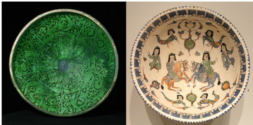
www.davidmus.dk صورة رقم ٢٢