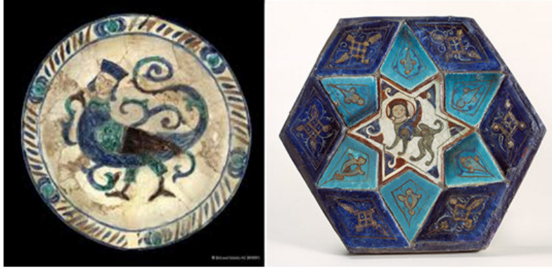
صورة رقم ٢٤: www.metmuseum.org صورة رقم ٢٣: islamicart.museumwnf.org