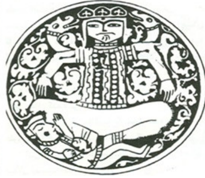
صورة رقم ٣: (كياني وكريمي، ١٣٦٤ش: ٢٧)