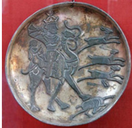
صورة رقم ۱۰: (ميرزایی، ۱۳۹۲ش: ۹۶)