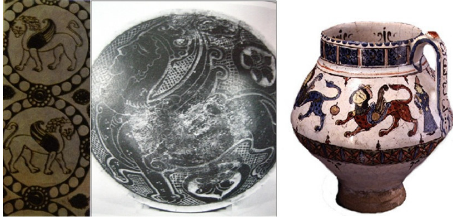
صورة رقم ٧: القماش على الجهة اليسرى (مهريويا والآخرين، ١٣٩١: ٨٢)