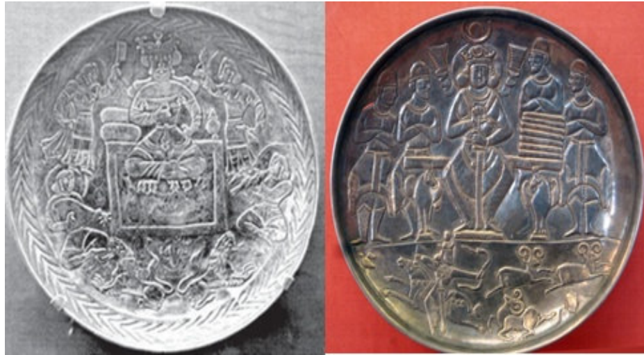
صورة رقم ١٩: (آزادبخت، ١٣٩١ش: ٥٩)