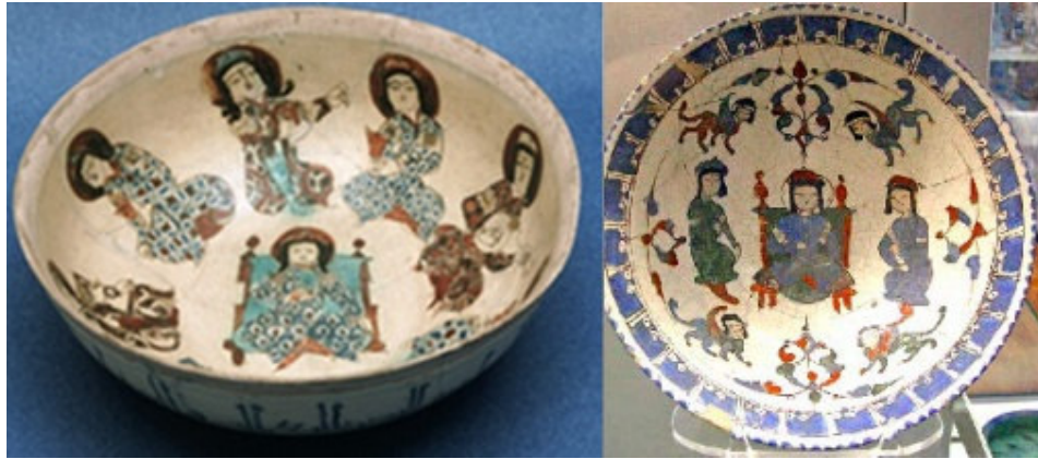
صورة رقم ٢٠: (حسيني، ١٣٩١ش: ٧٧)