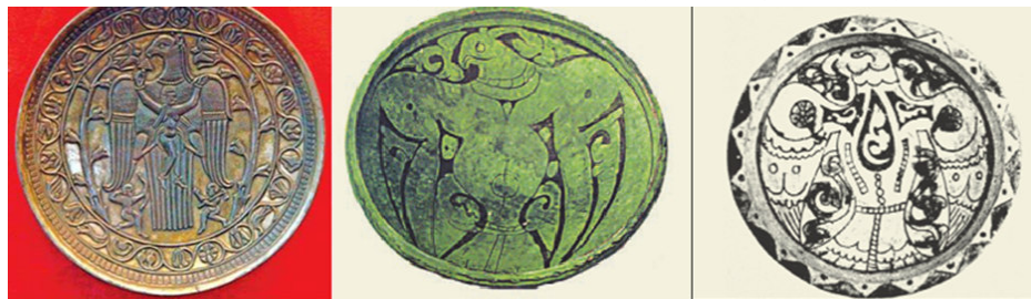
صورة رقم ۱۳: (هندي، قاضي زاده، ۱۳۹۱ش: ۴۹)