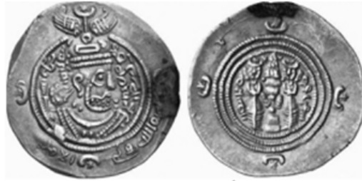
الصورة رقم ١: (رضاي باغ بيدي، ١٣٩٠ش: ٨٥-٨٦)

يجب أن نعلم بأن البنية الثقافية والاجتماعية كان لها تأثير كبير في الفنان وأثره الفني وهذا الاستقرار والدوام بالنسبة إلى البنية، يؤدي بدوره إلى حدوث الزخارف والمضامين. وبالتالي، من المنطقي جداً أن يعتمد الفنانون، ميراثهم الفني في آثارهم ويسعون في حفظه. على سبيل المثال، في بداية العصر الإسلامي، نشهد بأن تتسم سك العملات العربية الساسانية بخصوصيات العصر الساساني مثل: صورة معبد النار على العملات المعدنية. (راجع الملحق رقم ١ (الصورة رقم ١٧))