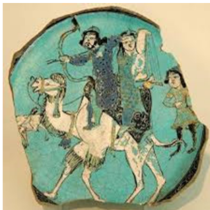
صورة رقم ۱۱: (حسینی، سید هاشم، ۱۳۹۱: ۶۸) صورة رقم ۱۲: (حسینی، سید هاشم، ۱۳۹۱ش: ۶۸)