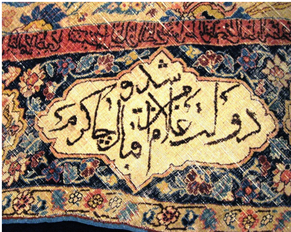
الصورة ٣ شطر من سجادة مثمانة بتبريز، العصر الصفوي، (متحف السجاد الإيراني، الصورة من الكاتب)