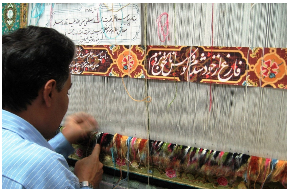
الصورة ٧ استخدام الخط في حياكة السجاجيد الجدد (متحف السجاد الإيراني)