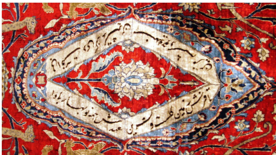
الصورة ٤ سجادة تبريز، القرن ١٤ الهجري (متحف السجاد الإيراني)