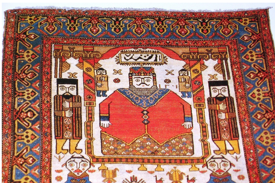
الصورة ٥ سجاد همدان، القرن ١٣ و موضوعة اسم هوشنك الملك الأسطوري (Ford,1992:197)