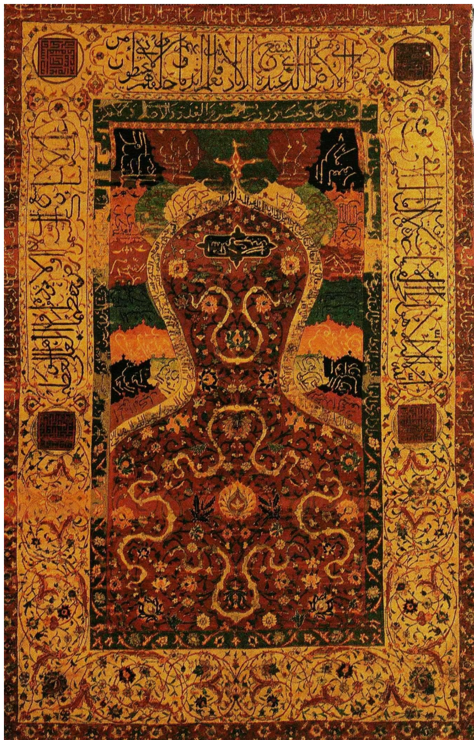
الصورة ٢ سجادة صلاة، العصر الصفوي، آيات قرآنية و عبارات مذهبة بخط الثلث (Day.1996:140)