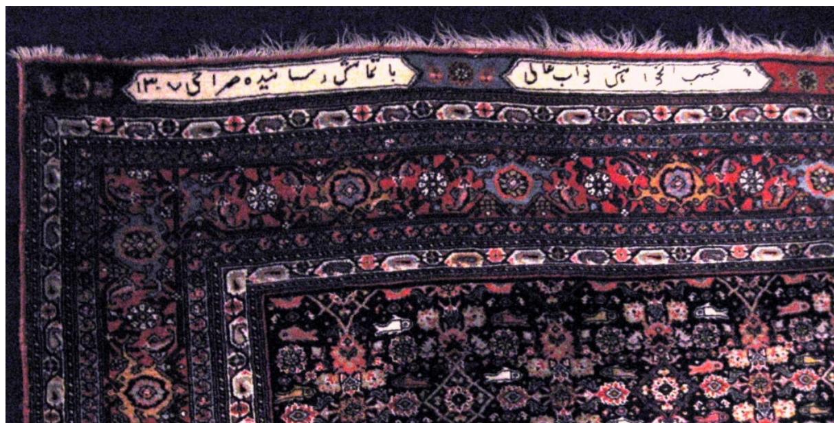
الصورة ٦ سجاد بيجار، أوائل القرن ١٤ الهجري (متحف السجاد الإيراني، الصورة من الكاتب) «حسب طلب النائب السامي اتمه صراحي