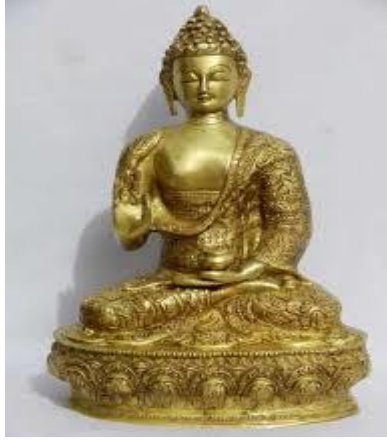
الصورة ١: تمثال بوذا باليدين

الشفرات وهذه العجلة تشير إلى الطرق الثمانية النبيلة وهي عبارة عن الرأي الصحيح والنية الصحيحة والخطاب الصحيح والعمل الصحيح والمعاش الصحيح والمحاولة الصحيحة والفكرة الصحيحة والتركيز الصحيح. فلعبارة «يد من نحاس» دور مهم لتوجيه ذهن السامع إلى بوذا الحقيقي.