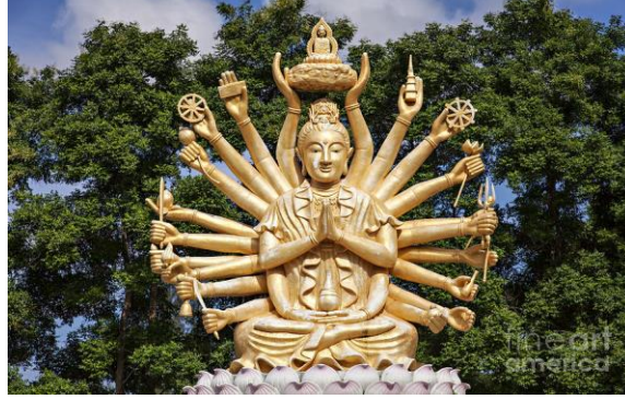
الصورة ٣: تمثال بوذا مع ٢٤ أيدي