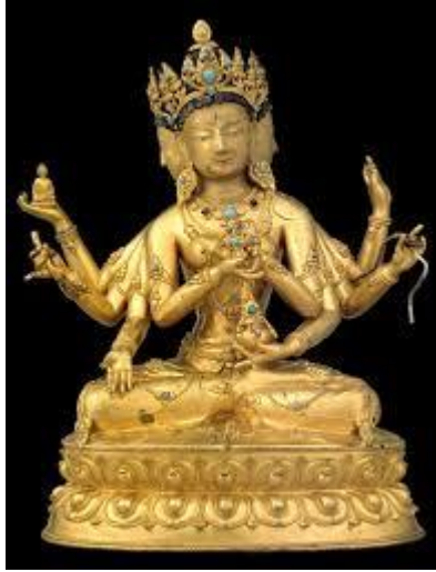
الصورة ٢: تمثال بوذا بالأيدي الثمانية