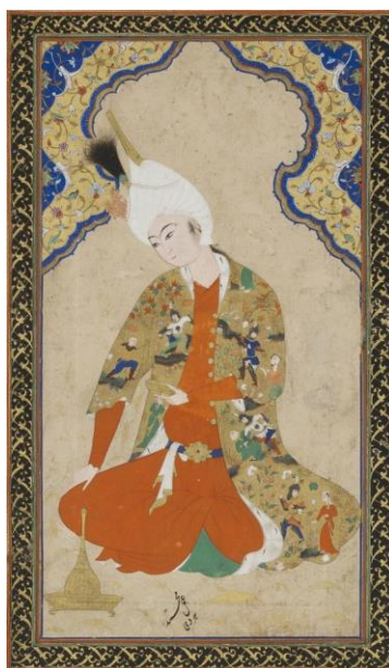
الصورة ١_٢_٤ : الأمير الشاب، محمد هرفي، القرن العاشر الهجري، الفترة الصفوية، مدرسة تبريز، معرض واشنطن الحر