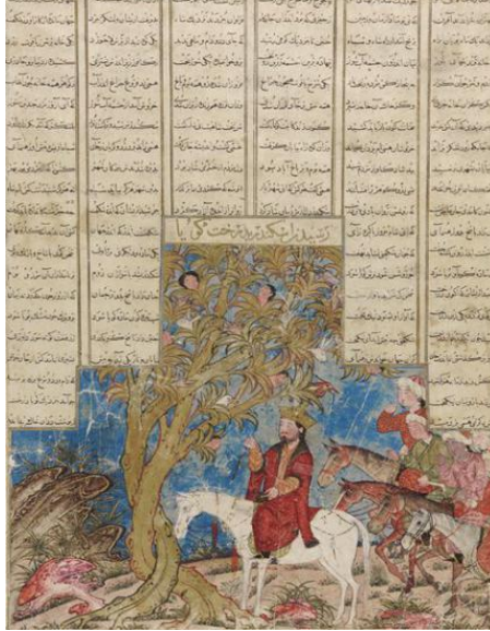
الصورة ١-٤-١، وصول الإسكندر إلى شجرة غويا، شاهنامه ديمو، ٧١٠ هـ، إيلخانز، فريز غاليري، واشنطن،