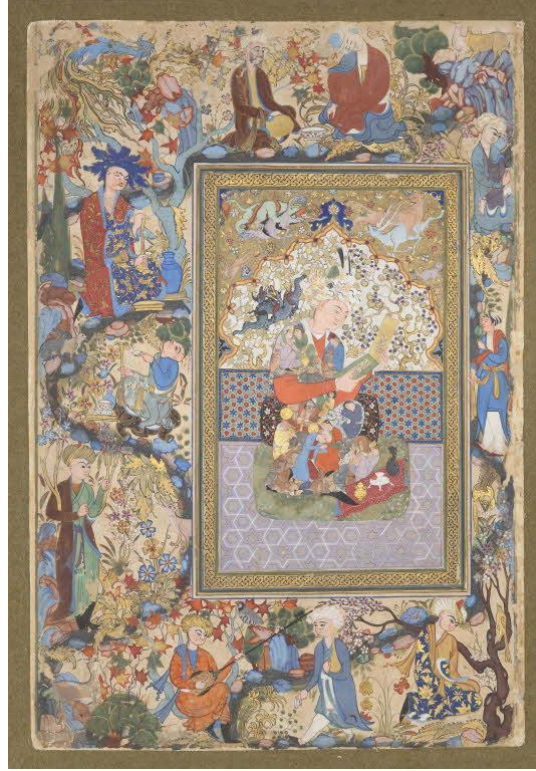
الصورة ٢-٢-٤ : مكتبة عبد العزيز خان، محمد مراد سمرقندي ومحمد شريف مصورة ، القرن الحادي عشر الهجري، العصر الصفوي، مدرسة بخارى، متحف اللوفر، باريس،