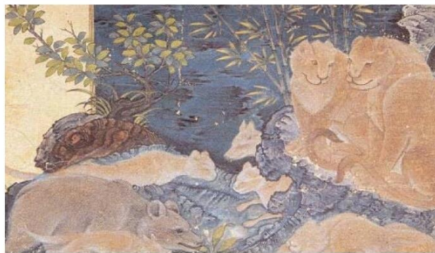
الصورة ٢-٤-١، روكس، كليله ودمنه، جلايريان، ٧٥٤ هـ، جامعة اسطنبول، تركيا، Kutuphane.Istanbul.edu.tr.

كما أنّ صورة مزيج الصخور مع وجوه الحيوانات والبشر في كتاب كليلة ودمنه في فترة الجلايري في النصف الثاني من القرن الثامن الهجري (الصورة ٢-٤-١) (نايفي، ٢٠١٢ : ٢٠). في هذه الصورة، تتشكل أشكال الحيوانات الصغيرة داخل جسم طبيعي مثل: الصخور لتكوين صورة شاملة. لكن هذه الأمثلة ليست هي الموضوع الرئيس للرسم أو ليست في وسطها، ولكنها لعبت دورها في الهامش وفي خلفية الموضوع الرئيس.