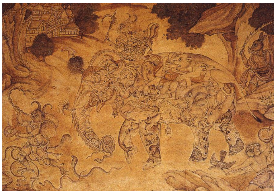
الصورة ٣_٤_١: فيل مجتمع، ١٥٩٠ م / ٩٦٩ هـ، القرن العاشر الهجري، عصر غورخانيد متحف آغا خان، أجرا الهند ،