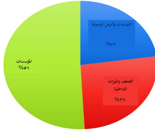
الرسم البياني رقم ١، تكرار التوجه النصي المستخرج من تحليل الخطاب

على حسب الترتيب ٥١٪ للمؤسسات، و ٢٦٪ للضعف والمزايا، و ٢٣٪ للتهديدات والفرص. من خلال تحليل محتوى المقابلات يمكن ملاحظة أنّ معظم العوامل لها نهج سلبي وهي مؤسسية. وهذا يتفق تماماً مع النظرية المقترحة في الإطار النظري للبحث.