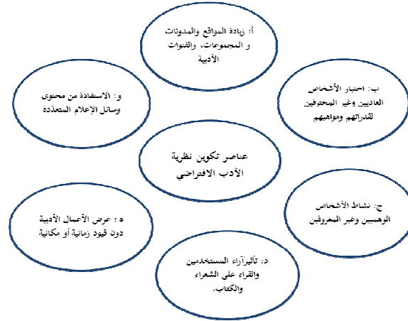
الشكل رقم ١- عناصر تكوين نظرية الأدب الافتراضي