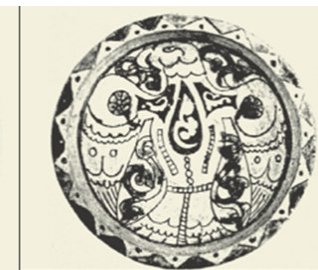
صورة رقم ۱۳: (هندي، قاضي زاده، ۱۳۹۱ش: ۴۹)