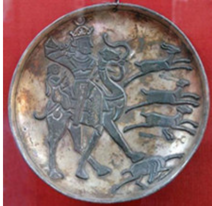
صورة رقم ۱۰: (ميرزايي، ۱۳۹۲ش: ۹۶)