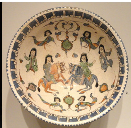
www.ttnots.com: ۲۱ صورة رقم