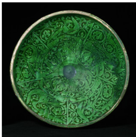
www.davidmus.dk ۲۲ صورة رقم