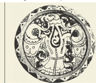
صورة رقم ۱۳: (هندي، قاضي زاده، ۱۳۹۱ش: ۴۹)